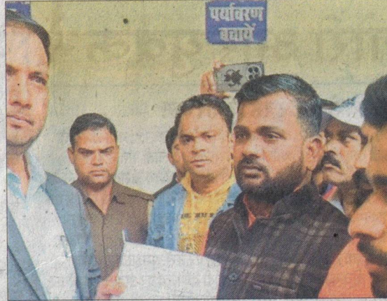
एसडीएम को ज्ञापन देते संगठनों के पदाधिकारी।

की जाए, जिससे क्षेत्र में कानून-व्यवस्था कायम रह सके। विहिप पदाधिकारियों ने पलिया के सिनेमा चौराहे के निकट खुले में बकरा काटकर बिक्री किए जाने पर भी आपत्ति जताई। उन्होंने ऐसी दुकानों