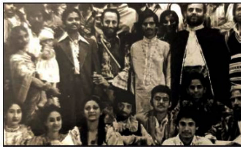
Actor Anupam Kher (in the centre) poses with the cast of the play 'Merchant of Venice', which he had directed and staged at Ravindrayala in 1980s. The cast included many LU students

Kher, who hails from Shimla, spent around three years (1979-81) in Lucknow as a lecturer at BNA. Later, this dynamic teacher came to be known for his prolific career in Indian cinema, having worked internationally in more than 500 films and 100 plays over a span of 35 years. He has in his credit films like