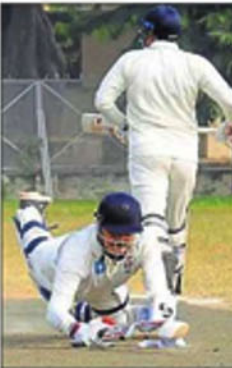
A batsman scampers to regain his crease after a collision with another player during the match.

cellor based on recommendations by a special committee. Students with the highest marks in their first semester will be invited by the committee to present their vision for the university and their proposed plans for the welfare of students. On the basis of their presentations evaluated on communication skills, content, vision and viability of future plans, MSC members will be selected.