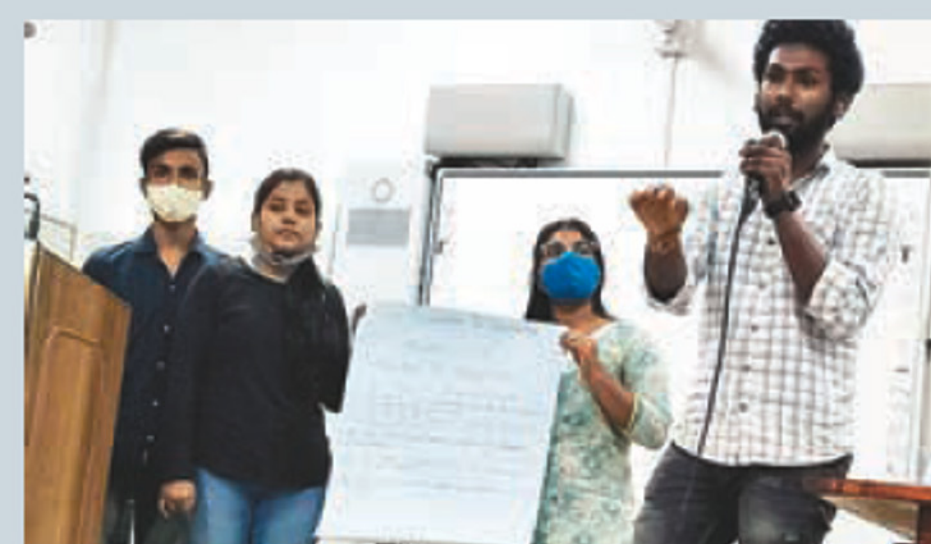
LU, Dept of Bio-Chemistry students attending the lecture