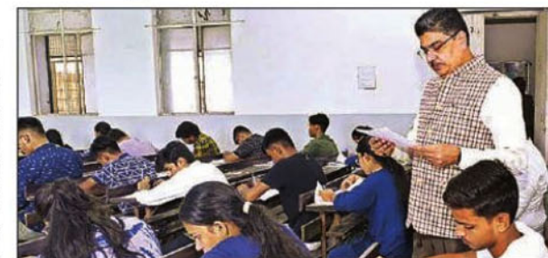
लविवि में प्रवेश परीक्षा का निरीक्षण करते लविवि कुलपति।