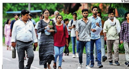
Around 90% of BCom & 80% of BCom (Hons) aspirants took exam on Thursday

"Entrance tests will get over by July 18 and results would be announced soon. We will wind up online counselling of first year by July end so that their classes can begin on Aug 1. We plan to hold semester examinations in