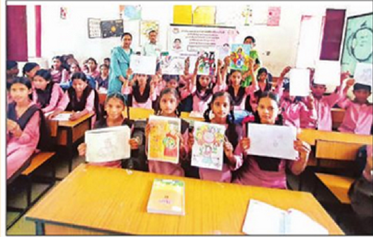
लविवि के नारी शक्ति वंदन कार्यक्रम में हिस्सा लेती छात्राएं।

गांवों में नारी शक्ति वंदन कार्यक्रम का आयोजन अमृत विचार, लखनऊ: लखनऊ विश्वविद्यालय ने अपने गेट लिए पांच गांवों में नारी शक्ति वंदन अधिनियम के तहत जागरूकता कार्यक्रम आयोजित किए। पंडित दीनदयाल उपाध्याय शोध पीठ के तत्वाधान में बखशी का तालाब क्षेत्र के भैसामऊ, गाजीपुर, डीगुसुर, मिश्रीपुर और सोनवा गांवों में रैली व शैक्षिक कार्यक्रम हुए। इनमें महिलाओं के सशक्तिकरण और लोकतंत्र में उनकी भागीदारी के महत्व से अवगत कराया गया।