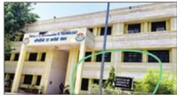
लविवि के द्वितीय परिसर में अभियांत्रिकी विभाग के बगल में लगाया गया विधि संकाय का बोर्ड।

कुलसचिव बोलीं- छात्र हित में लिया फैसला विधि संकाय में शामिल होंगे तीन भवन