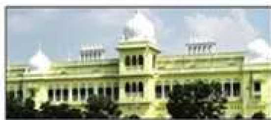
लविवि ने यूजी में अंतिम तिथि 15 से 22 जून की, पीजी के लिए 25 जून तक कर सकेंगे आवेदन