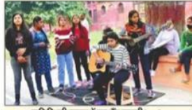
लविवि की छात्राओं का बैंड रुहानी। - संतर

यहीं अदम्य नाट्य संस्था ने नुककड़ और गुफ्तगू के माध्यम से एक परिवर्तन लाने का प्रयास किया। इसके सदस्यों ने शादी, लिंग भेद,