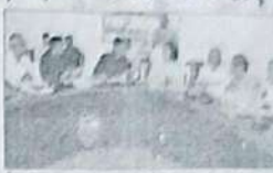
एक परिवार के सदस्यों का एक कार्यक्रम में भाग लेना...