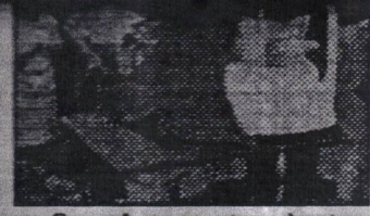
आधुनिक मशीन का शुभारंभ करते प्रबंधक, चिकित्सक व अन्य

प्रारंभिक अवस्था में ही पता लगाया जा सकेगा। साथ ही मॉडर्न बिजनेस ऑपरेशन की बेहतर योजना बनाने में भी यह तकनीक उपयोगी सिद्ध