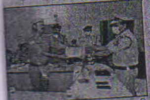
प्रशस्त पत्र देकर सम्मानित सम्मनित को है। लखनऊ अनुभाग के जीआरपी पुलिसकर्मियों को उत्साह वर्धन एस्पी