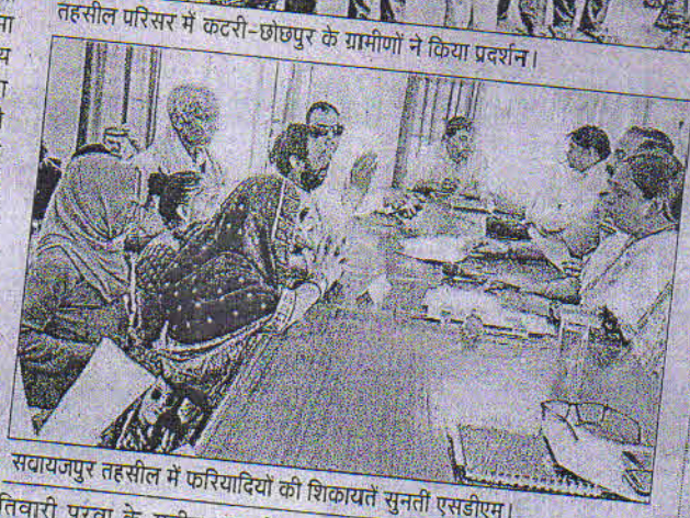
सवायजपुर तहसील में फरियादियों की शिकायतें सुनती एसडीएम।

तहसील परिसर में कटरी-छोछपुर के ग्रामीणों ने किया प्रदर्शन।